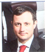
di PIER PAOLO VIANI (SIAV)